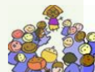
Education Thérapeutique Patient