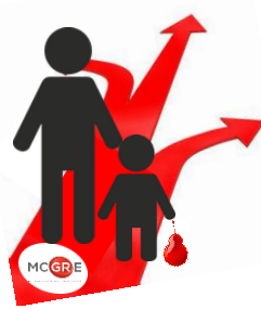
Parcours de soins